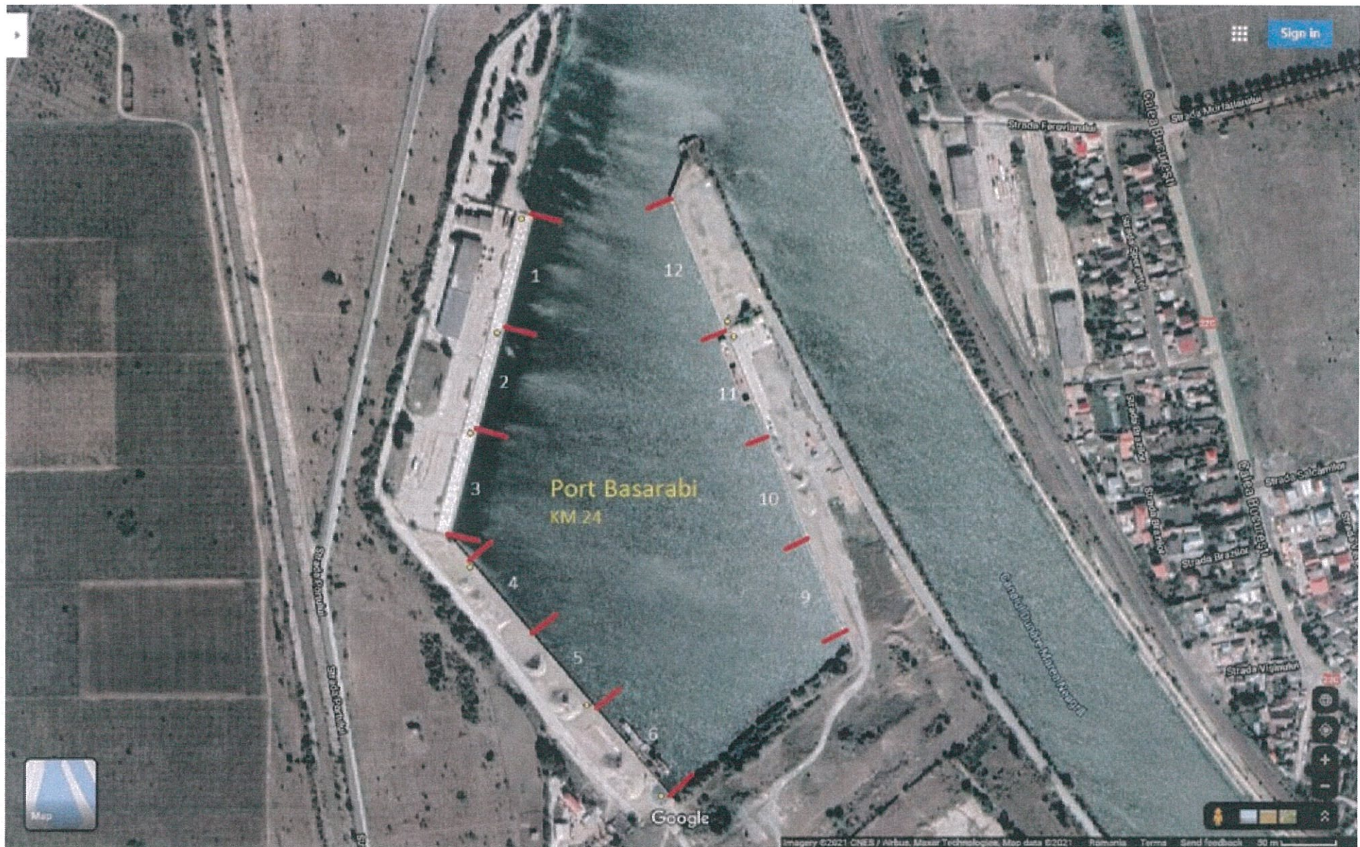
ANEXA nr. 2 PORTUL BASARABI/CDMN