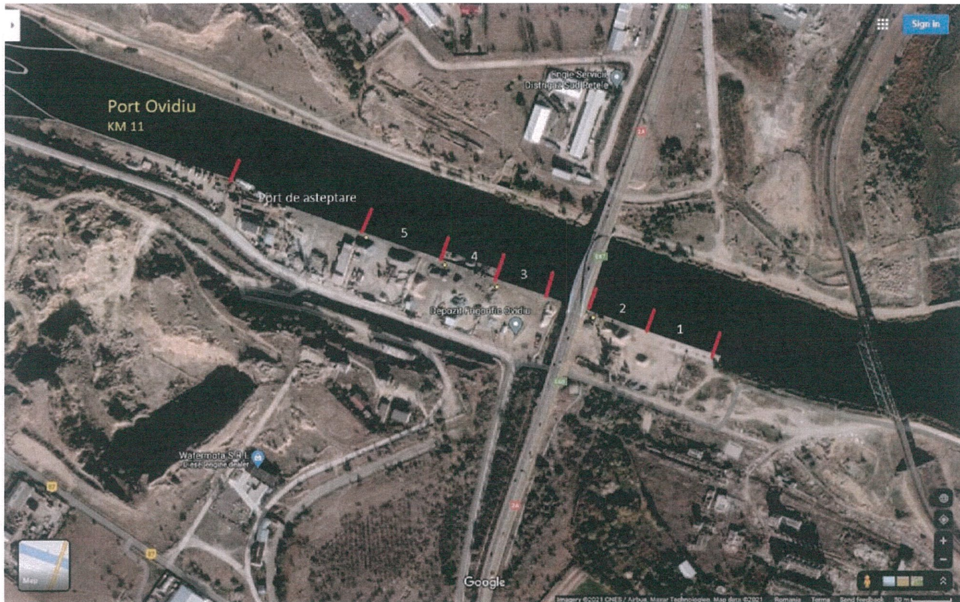
ANEXA nr. 2 PORTUL OVIDIU/CDMN